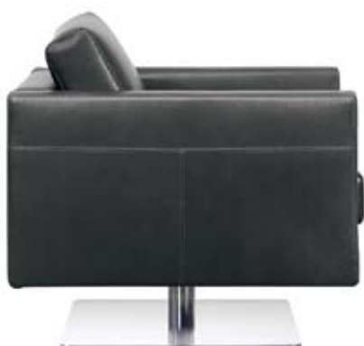
„park swivel armchair“ hersteller: vitra